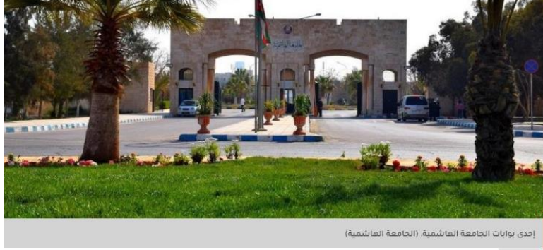
إحدى بوابات الجامعة الهاشمية.

سمح مجلس عمداء الجامعة الهاشمية بتقسيط الرسوم الجامعية للطلبة، اعتباراً من بداية الفصل الدراسي الثاني للعام الدراسي الحالي، تسهيلاً على الطلبة وذويهم.